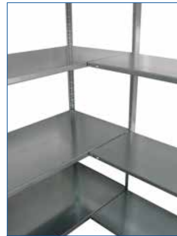
Perfect open hoeken met langsverbinders

Iedere extra aanbouw aan het eerste aanbouwrek : + 6 mm + lengte LEGBORD